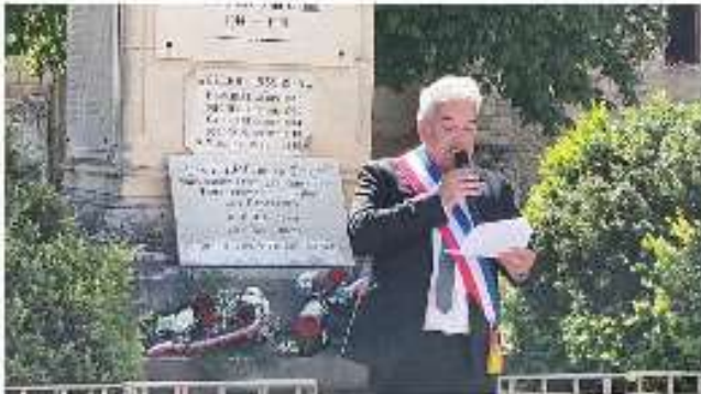
Hommage à M. de Saint Léon