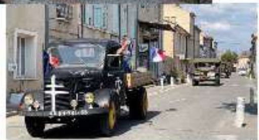
Journée du Patrimoine

La municipalité qui a initié ce cycle de commémorations remercie tout particulièrement les associations Les Rendez-vous de Puimoisson, les Poètes des Hautes terres et le Comité des Fêtes de Puimoisson qui ont permis le succès de ces 6 mois d'événements très divers. Un grand bravo à toutes les personnes impliquées. Leur dévouement et leur énergie ont certainement apporté une grande richesse à la vie de Puimoisson.