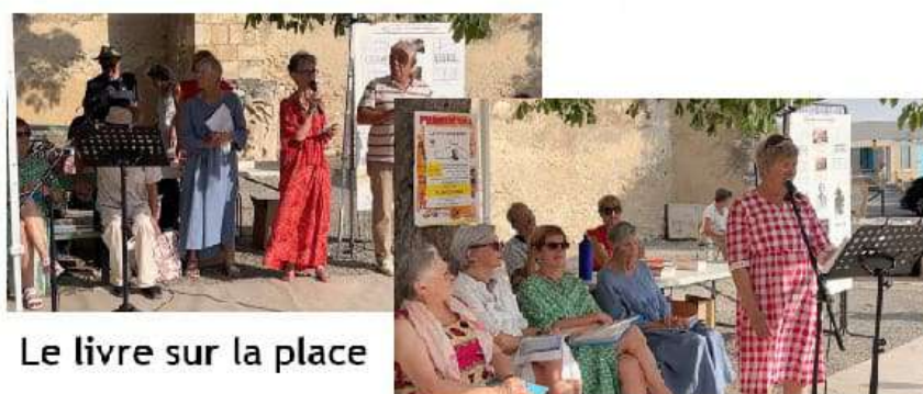
Le livre sur la place