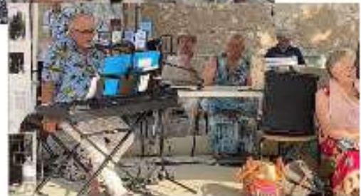
Le livre sur la place