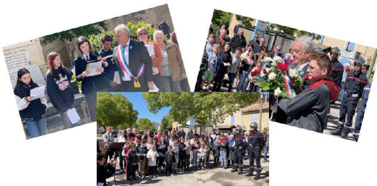
Cérémonie du 8 mai

Voici une petite rétrospective des événements qui ont jalonné ces 6 mois.