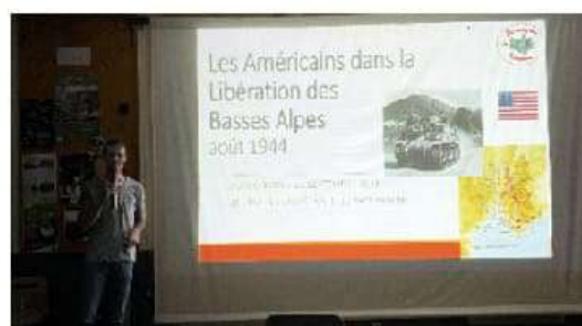
Romain Cansiere « Les Américains dans la Libération des basses Alpes »