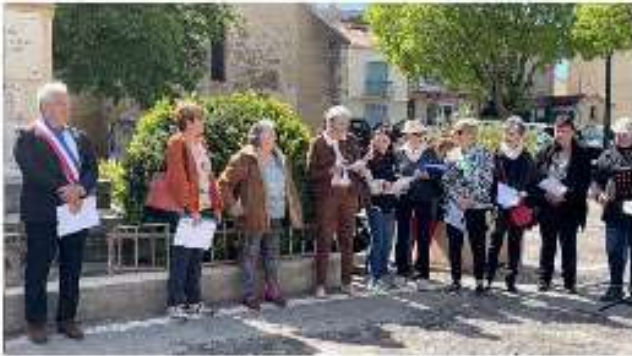
Les 5 du monuments aux Morts