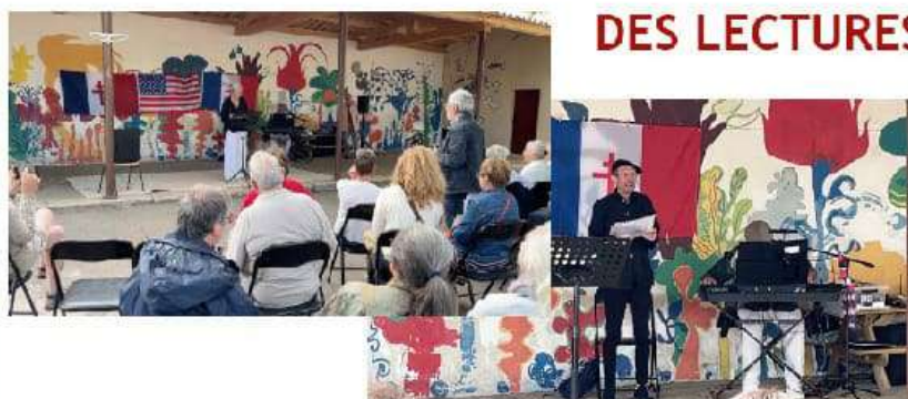
Festival Poésies et Chansons