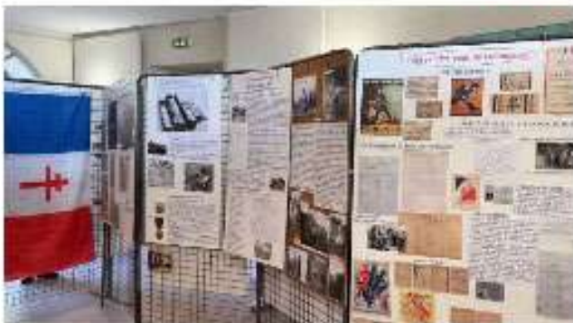
Puimoisson pendant la guerre