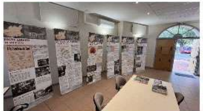
La répression allemande dans les Basses Alpes