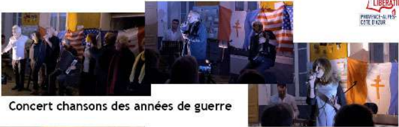
Concert chansons des années de guerre