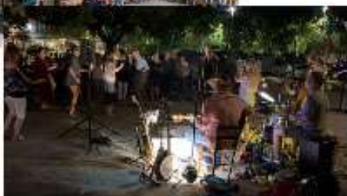
Fête du 14 juillet