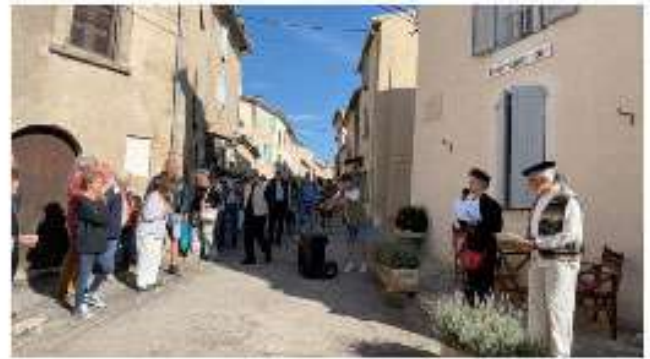
L'attaque du poste de garde allemand