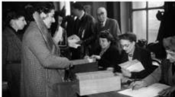
Elections municipales du 29 avril 1945

En France, alors que les hommes obtiennent le droit de vote "universel" en 1848, ce n'est qu'un siècle plus tard que les femmes peuvent l'exercer pour la première fois,