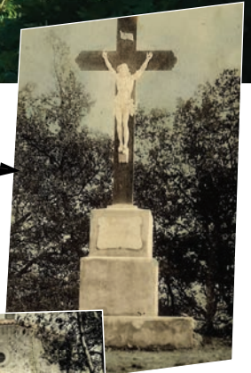
La grande croix du Christ

Derrière l'ermitage une avenue bordée de buis fut tracée aboutissant à un tertre