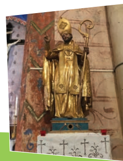
Statue de Saint-Eloi

Ce clocher est surmonté d'un campanile en fer forgé fabriqué et offert par le maréchal ferrant du village. Nous pouvons découvrir la date de sa réalisation par les clés en fer forgé qui rattachent le clocher à l'église : 1741.