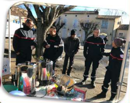
Les pompiers ont répondu présent avec leur calendrier et leur délicieux vin chaud