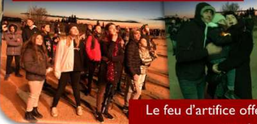
Le feu d'artifice offert par la mairie a clôturé avec éclat la journée