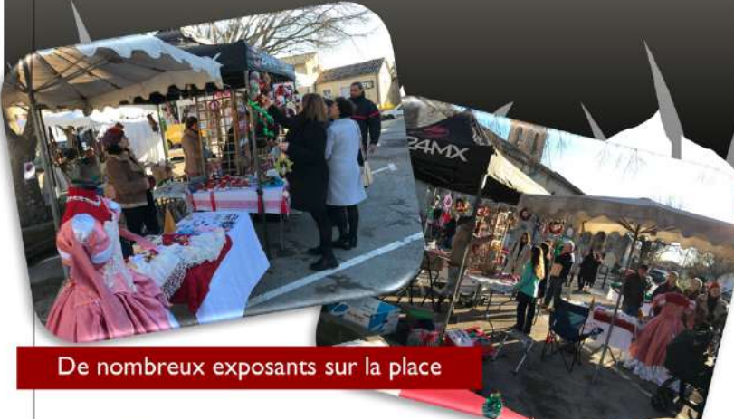
De nombreux exposants sur la place

Organisé par le Comité des Fêtes de Puimisson