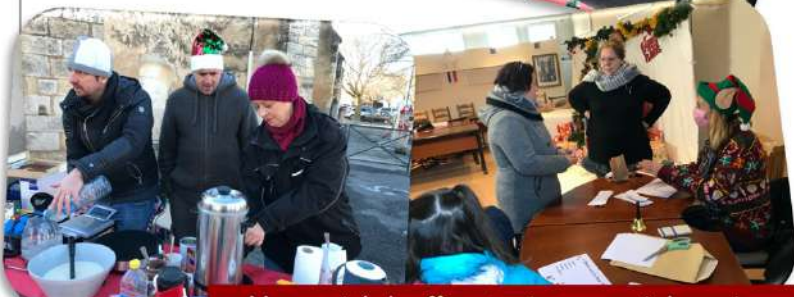
Un comité des fêtes toujours aussi dynamique